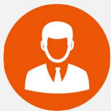
T・H IT統括部 執行役員

プログラマーとしてキャリアを出発し、WebMoney社の創業期から事業・システムの両面を担うとともに、早くから経営にも参画。上場を経て、さらなる成長ステージを目指し、同社と共にKDDIグループへジョイン。au WALLETプリペイド（現 au PAY）では、サービス企画からシステム設計、PMまでをテックサイドで一気通貫して担当。 現在はIT統括部担当執行役員として、経営とITをつなぐ立場から、グループ横断のセキュリティ強化およびITガバナンス高度化を推進している。