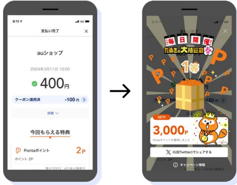
<決済完了画面/抽選画面>