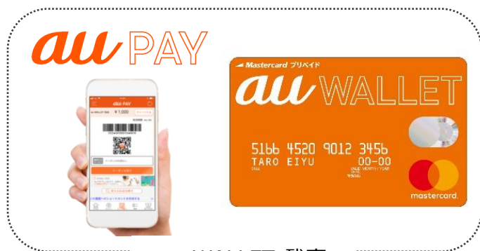
au WALLET 残高

なお、チャージされた「au WALLET 残高」は、「au PAY」や「au WALLET プリペイドカード」としてお店でのお買い物やお支払いにご利用いただけます。