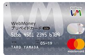
<WebMoneyプリペイドカード Lite>

「WebMoneyプリペイドカード/WebMoneyプリペイドカード Lite」の詳細はこちら