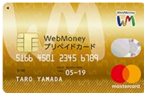
<WebMoneyプリペイドカード>

また、2019年10月から始まる「キャッシュレス・消費者還元事業」で承認されたカードで、対象店舗でご利用いただくと最大5%のポイントが還元されます。