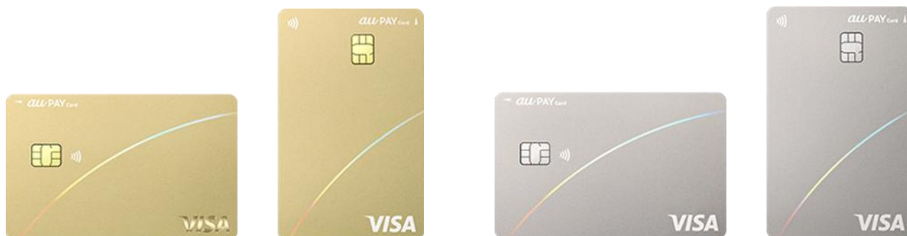
<デザインをリニューアルした「au PAY ゴールドカード」「au PAY カード」> (注1)

新しい「au PAY カード」は、角度によって7色に輝く透明なホログラムを使用したシンプルかつスタイリッシュなカードデザインにリニューアルしました。デザインのリニューアルに加え、Google Pay™ への対応による Android スマートフォンでのタッチ決済や、アプリ利用速報通知などの各種機能にも対応し、より安心・便利に au PAY カードをご利用いただけます。